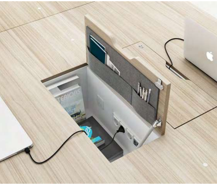
Arquivo interior altura dupla | Archivo interior altura doble Inner filing double high | Fichier intérieur double hauteur

A FAMO reserva-se no direito de modificar e melhorar as características dos produtos apresentados neste catálogo, a fim de atender às exigências do mercado. Embora reproduzidos o mais fielmente possível, as cores dos produtos ilustrados podem ser diferentes daqueles dos produtos reais. Os veios das madeiras são indicativos e podem variar de acordo com o lote de produção. Para obter informações precisas sobre as especificações detalhadas dos produtos, consulte-nos.