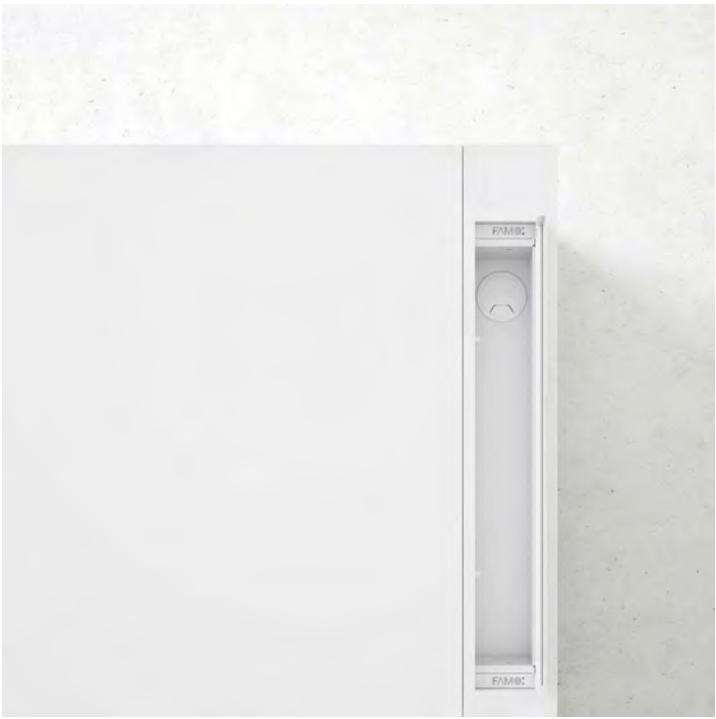
Passa-fios | Passa cables | Integrated plug | Passe-câbles