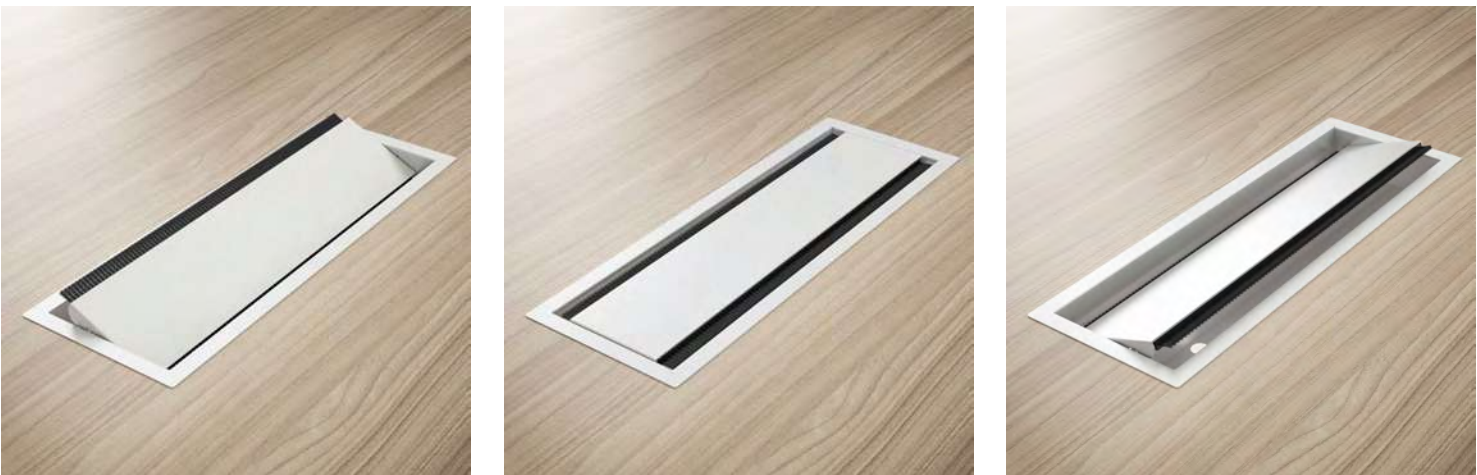
Versão metálica | Versión metálica | Metallic version | Version metal