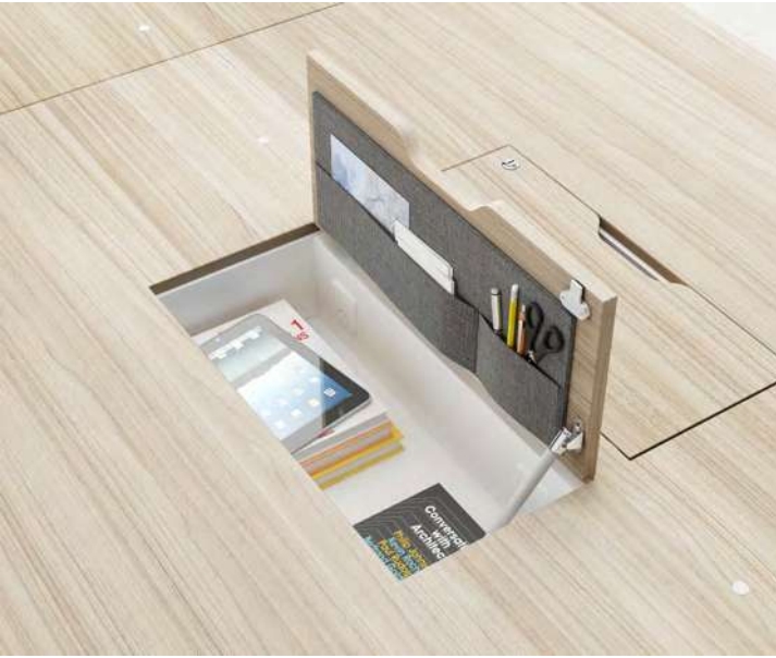
Arquivo interior altura média | Archivo interior altura media Inner filing medium high | Fichier intérieur hauteur moyenne