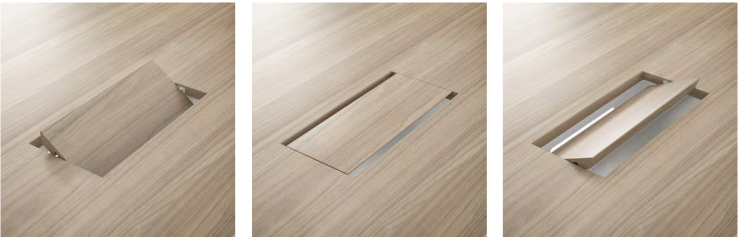
Versão madeira | Versión madera | Wood version | Version bois