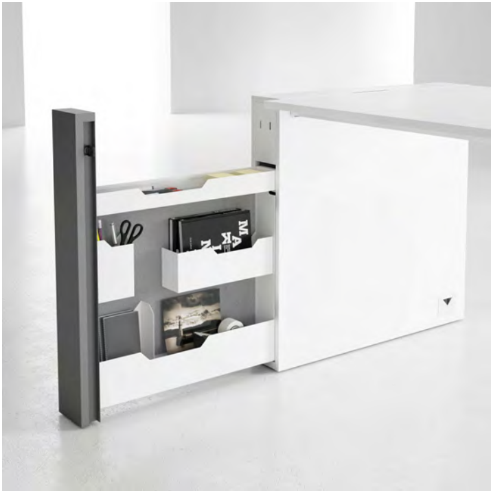
Fixação por velcro | Fijación por velcro Velcro fixing system | Fixation par velcro