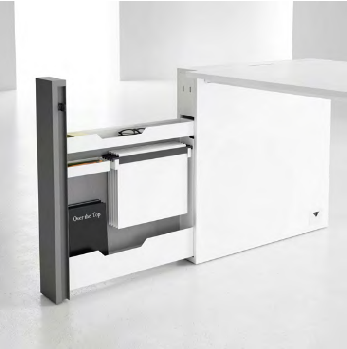
Fixação em calha metálica | Fijación en viga metálica To fix in metallic beam | Fixation sur gouttière métallique