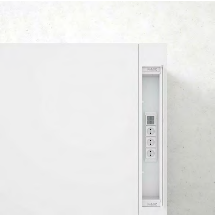
Tomada integrada | Enchufes integrados Integrated power socket | Prise de courant intégrée